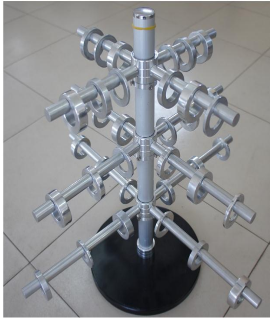
<작업 예시> <කාර්යය නිදර්ශන>